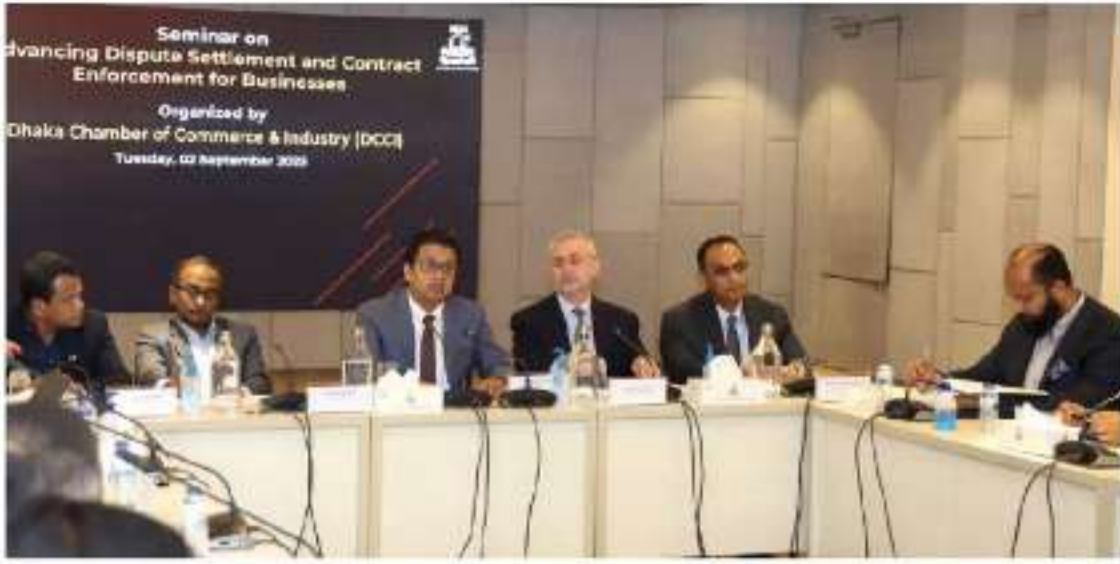
Today, a seminar titled "Advancing Dispute Settlement and Contract Enforcement for Businesses" held at the DCCI in the capital.

DHAKA, Sept 2, 2025 (BSS) - Experts at a seminar here today laid emphasis on resolving trade-related disputes outside traditional courts for reducing overwhelming pressure on the judiciary substantially and improving the overall business climate.